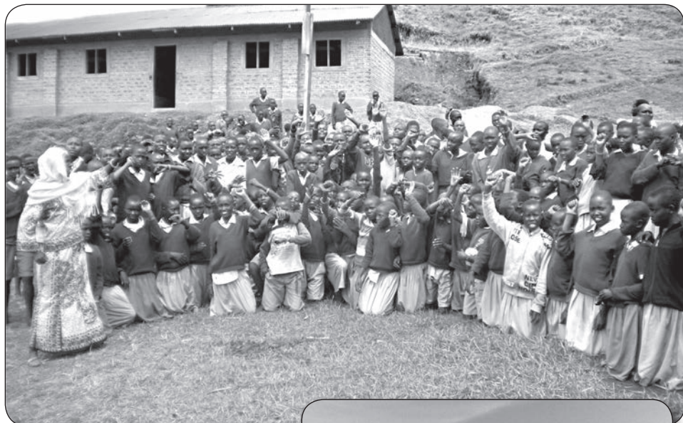
Bijeenkomst tegen de vrouwenbesnijdenis in Ptarkong