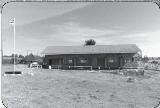
Opening 16 januari 2012 Winners Girls Highschool Keringet