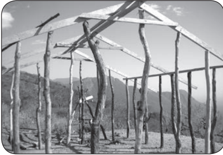
Bouw van lokaal Chpotwoschool

tial mutulation) Marie Stopps uit Kitale hebben we zover gekregen dat ze ook hier faciliteiten bieden voor geboortepanning.