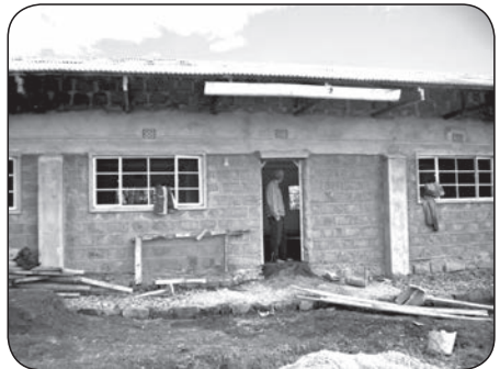
Bouw van de middelbare school voor atleten in Keringet

Op 16 januari 2012 is de WINNERS GIRLS HIGH SCHOOL in Keringet officieel van start gegaan; we hadden de keuze gemaakt om de opening heel eenvoudig en kleinschalig te doen, maar toch even stil te staan bij dit moment. Een officiële opening met veel genodigden zou teveel geld kosten wat we op dat moment niet hadden, maar ook omdat we de school van een kleinschalig project willen laten groeien en we het spreekwoord: "hoge bomen vangten veel wind". ter harte nemen. Toch waren er op die zonnige maandagmorgen alles bij elkaar zo'n 125 mensen, studentes, leraren, ouders, burens en verdere betrokkenen.