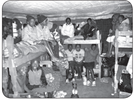
Slaapverblijf van 15 atletes in Keringet