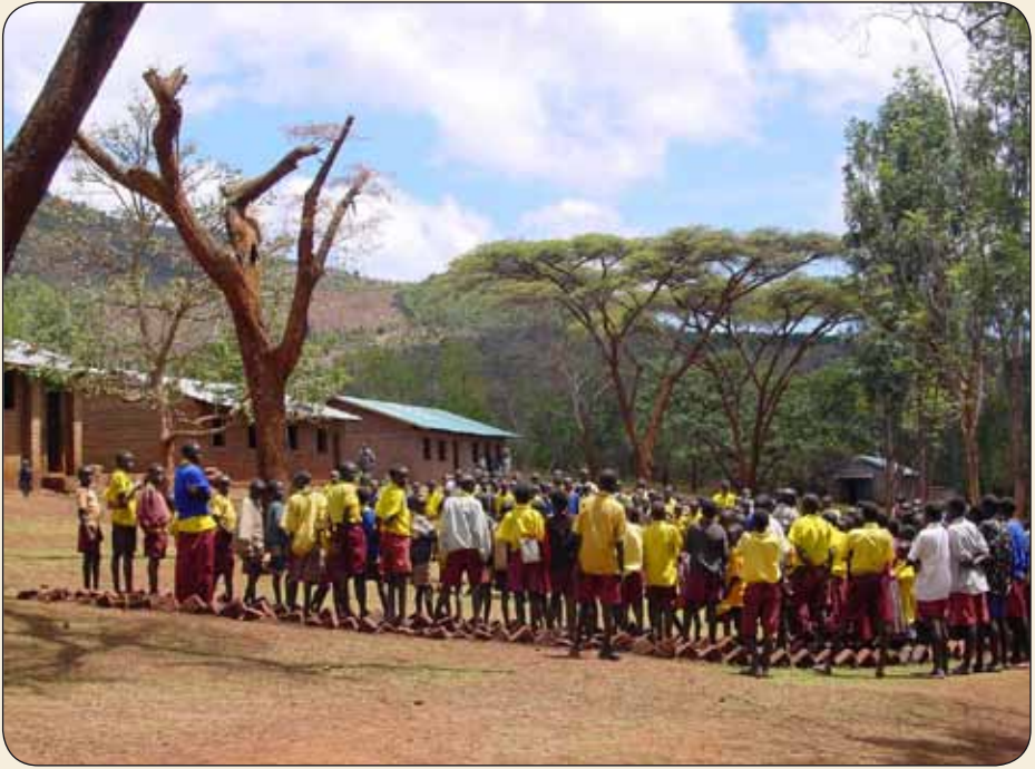
Kinderen gaan naar school in Mbara