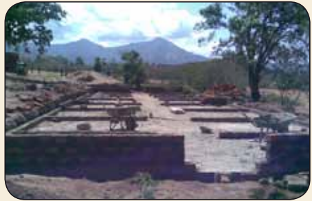
Fundering boardingschool in Sengelel - mei 2009

Eind vorig jaar zijn de activiteiten gestart voor de bouw van een boardingschool in Sengelel, een slaapegebouw waar de meisjes intern verblijven. De kosten waren geraamd op 14.000 euro. Wings of Support van de