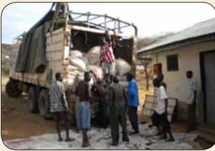
Maïs aankopen in Kapenguria

Omdat de honger in en rond Mbara al zo duidelijk zichtbaar was besloot onze stichting een partij maïs aan te kopen. De leerlingen, van veertien verschillende scholen uit de regio, zouden zorgen voor het transport in de bergen. Op 21 september j.l. was alles geregeld.