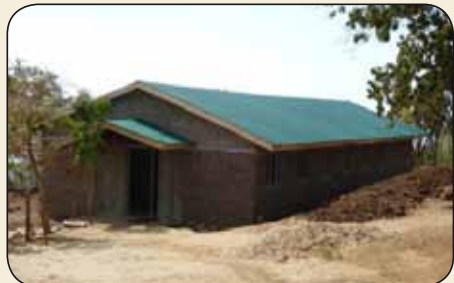
Boardingschool in Sengelel.

Eind december zal de dorpsoudste het gebouw openen en kunnen de meiden uit Sengelel en omgeving zich ongestoord op hun opleiding storten.