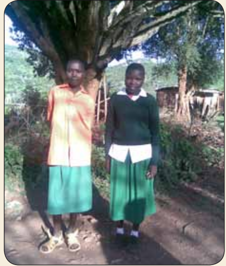
Meisjes van de boardingschool

Ongeveer 15 % van de leerlingen heeft de mogelijkheid door te leren op een middelbare school; de kosten hiervan bedragen ongeveer 450 euro per jaar; een immens bedrag voor de bewoners uit West Pokot; vanwege geldtekort onderbreken veel leerlingen hun opleiding met meerder maanden of zelfs een jaar. Dit komt de resultaten uiteraard niet ten goede.