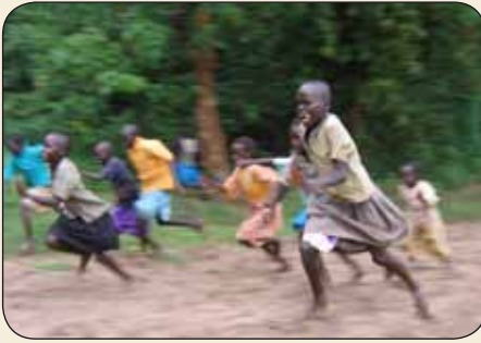
Hardloopwedstrijd voor meisjes