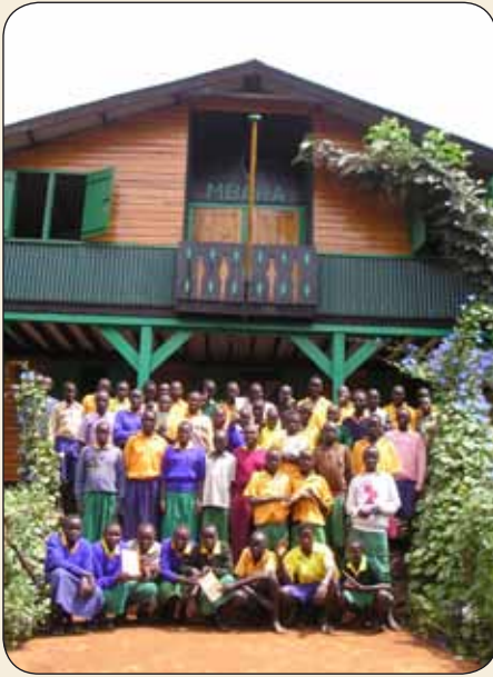
Hoogste groep Mbaraschool

Over de vooruitzichten voor het dichten van de kloof ben ik somber. Meestal, maar zeker in crisistijd wegen de eigen economische belangen het zwaarst. Er valt nog veel ontwikkelingswerk te doen, zeker ook in eigen land.