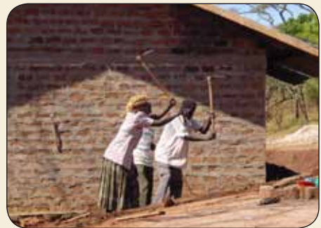
Aan het werk