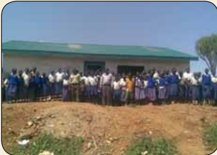
Lerarenkamer in Chepkondol

In Chepkondol, een gehucht in het Seker gebied op een uur lopen van Mbara, zijn de bouwactiviteiten na een half jaar afgerond en kon de lerarenkamer in gebruik worden genomen. In deze ruimte kunnen de elf leraren het schoolwerk nakijken, vergaderen en de lunch