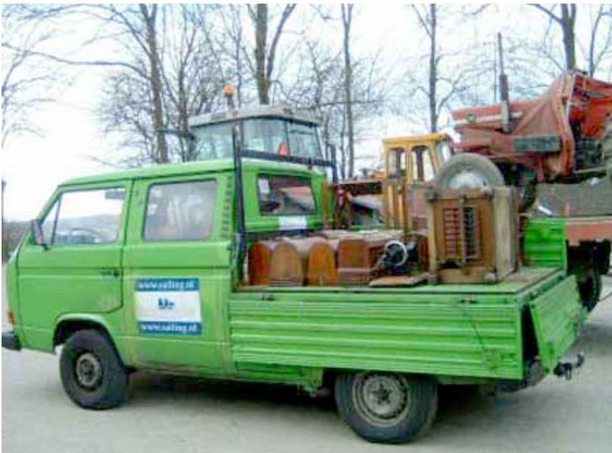
Naaimachines en tractor op weg naar Kenia