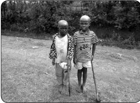
Twee spelende kinderen in Keringet