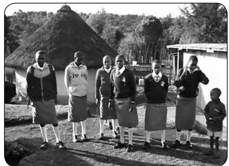
Leerlingen van de Keringet Winners Girls Highschool

Terugkijkend op 2012 zijn we tevreden. Om-