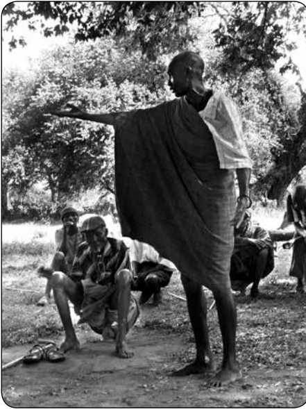
'Mijn zus is incontinent geworden als gevolg van de besnijdenis'