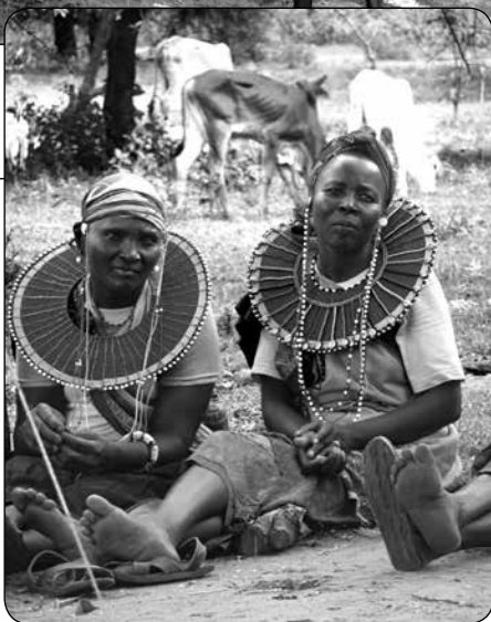
Vrouwen in Masol Hills

De nieuwsbrief is bestemd voor iedereen die, op welke wijze dan ook, de stichting 'Samen Succes' heeft gesteund.