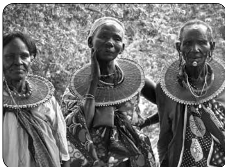
Vrouwen in Masol hills