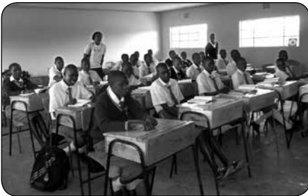
Leerlingen aan het werk