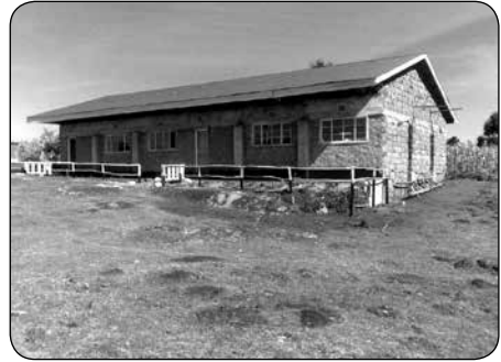
De eerste twee klaslokalen zijn af, januari 2012

Het Ministerie van Onderwijs neemt aan het eind van het schooljaar een nationaal examen af en vergelijkt de resultaten van de scholen. Van de tien scholen in de regio, behaalde onze school een vijfde plaats. Met deze plaats waren alle partijen tevreden en het doel voor komend schooljaar is om minimaal één plaats te stijgen op de ranglijst.