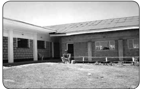
Uitbreiding van de school

samenspraak met het Ministerie van Onderwijs en na een huisbezoek van onze manager, worden deze leerlingen geselecteerd. Het zijn voornamelijk kinderen die op de lagere school - die in tegenstelling tot de middelbare school gratis is - heel goede resultaten behaalden, waarvan de ouders zijn overleden en die bij oma wonen. Global Sports Communication ( www.globalsportscommunication.nl ) betaalt het schoolgeld voor een aantal schoolgaande meisjes die goed zijn in hard-