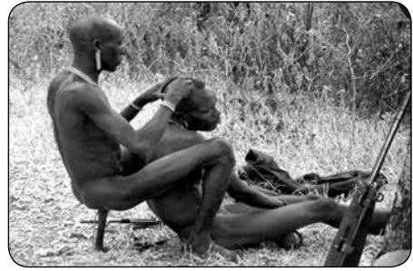
Pokot warriors scheren elkaar en waken over het vee

Om veel mensen bijeen te krijgen, is het in nieuwe gebieden belangrijk een geit en een zak mais mee te brengen. Mensen zijn immers de hele dag bezig met hun dagelijkse behoeften: water halen, hout sprokkelen, maaltijd bereiden en met het vee rondtrekken. Als ze naar de bijeenkomst komen, hebben ze hiervoor geen tijd en op deze manier kunnen ze toch een maaltijd nuttigen. Ook