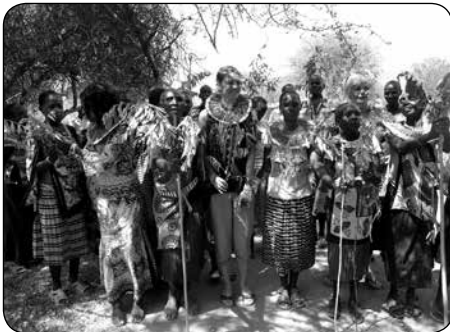
Ontvangst in Sigor