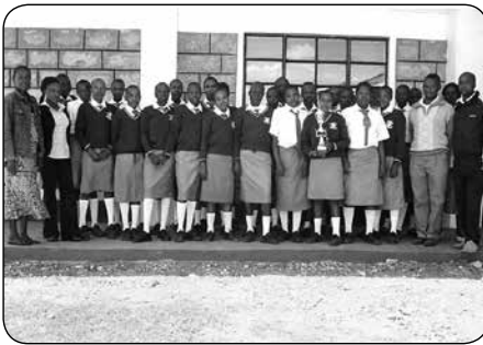
Leerlingen en staf van de school in Keringet