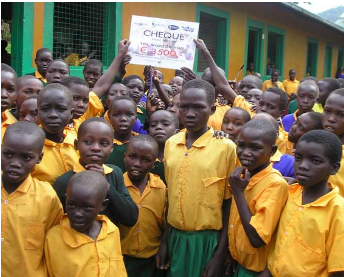
Een cheque ter waarde van € 3500 aangeboden door de Local Heroes school in Gaanderen.