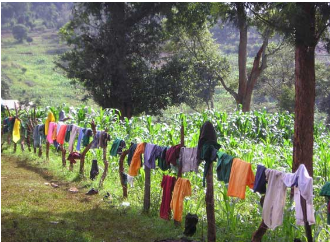
De was van de boardingschool.