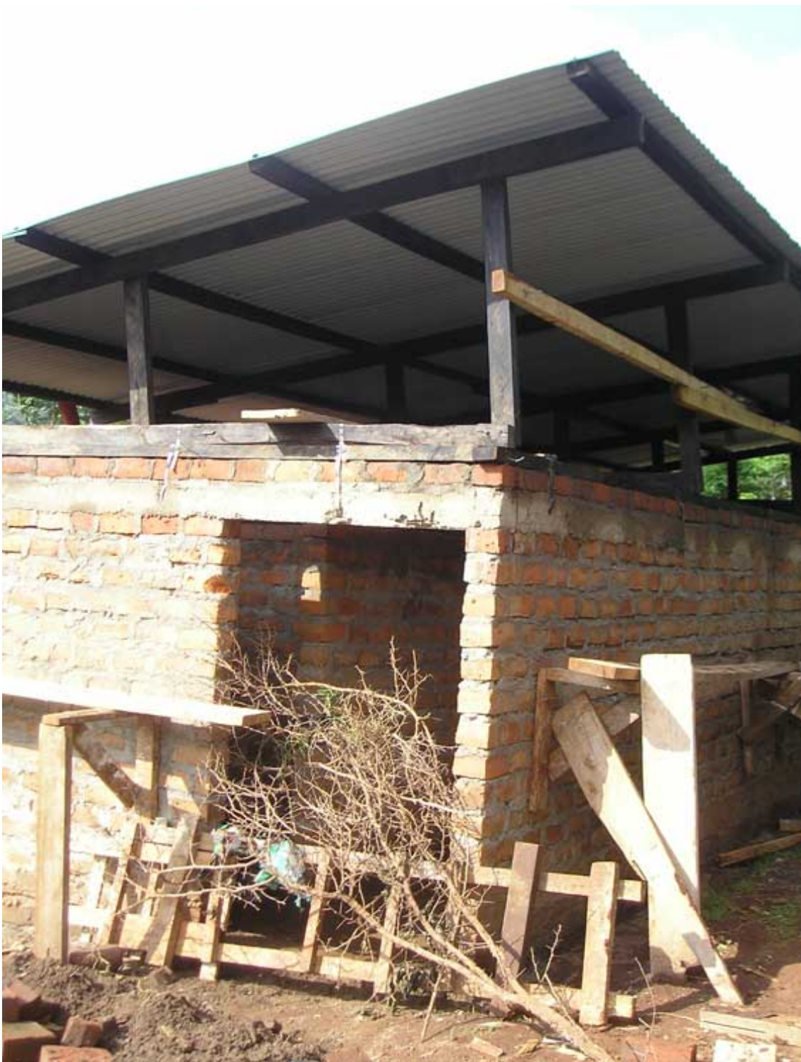
De bouw van een toiletgebouw

Ieder tot dusver hartelijk dank voor de ondersteuning. We houden u op de hoogte.