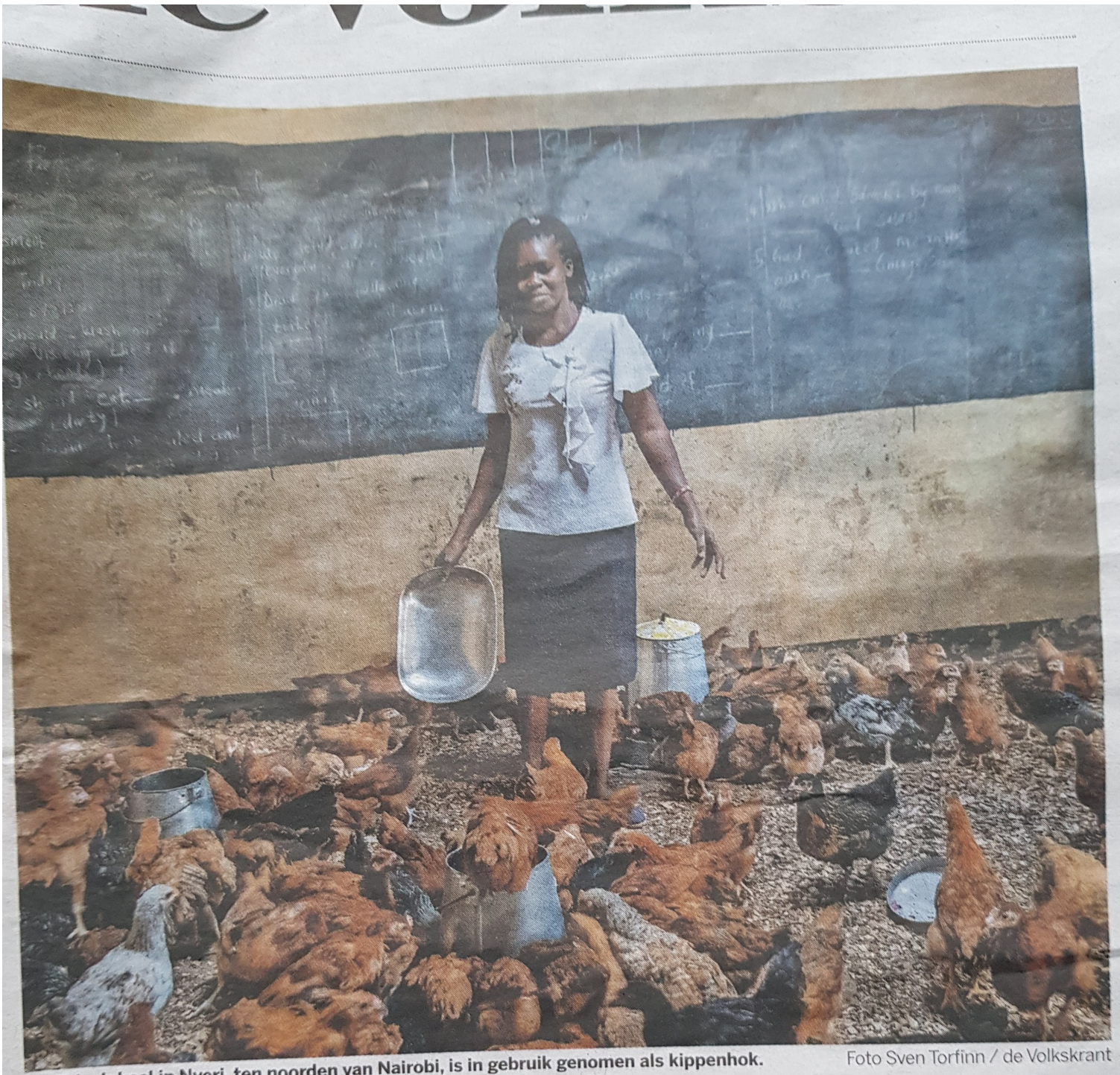
Een klaslokaal in Nyeri, ten noorden van Nairobi, is in gebruik genomen als kippenhok.